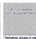
Serbatoio zincato e caldo